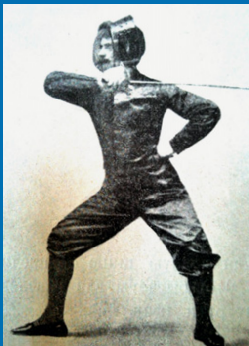
«Септим-отбив» (слева) и вторая фаза локтевого мушкетера. Из учебника Барбазетти, 1909 г.

у Барбазетти фехтует вся аристократия, а обученные им офицеры показали на практике такие блестящие успехи, что теперь его метода имеет громадное значение у наших военных авторитетов, и лучшие преподаватели фехтования в армии официально командуются в его школу».