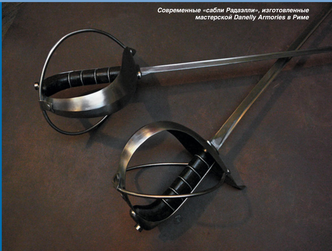
Современные «сабли Радаэлли», изготовленные мастерской Danelly Armories в Риме

Часть II. Начало см. «КАЛАШНИКОВ» №6/2012